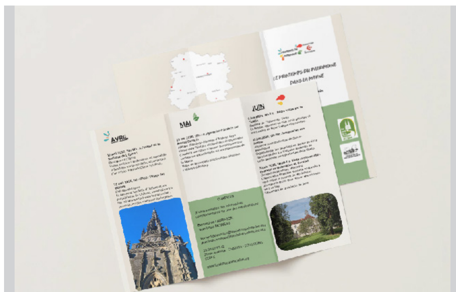
Flyer du printemps du Patrimoine dans la Marne

https://www.fondation-patrimoine.org/fondation-du-patrimoine/champagne-ardenne/